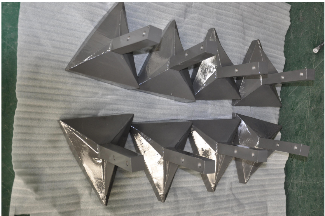
物料混合搅拌器表面制备耐磨耐腐蚀防污染涂层