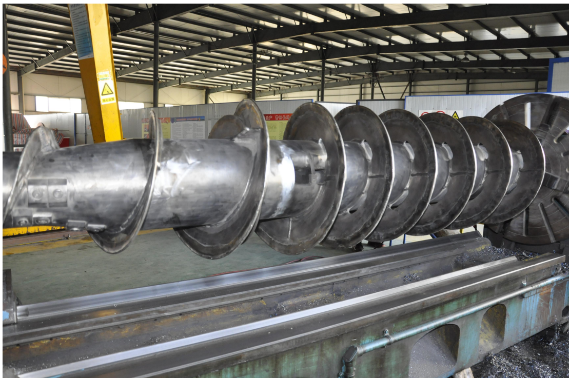
物料输送螺旋轴表面制备耐磨耐腐蚀涂层