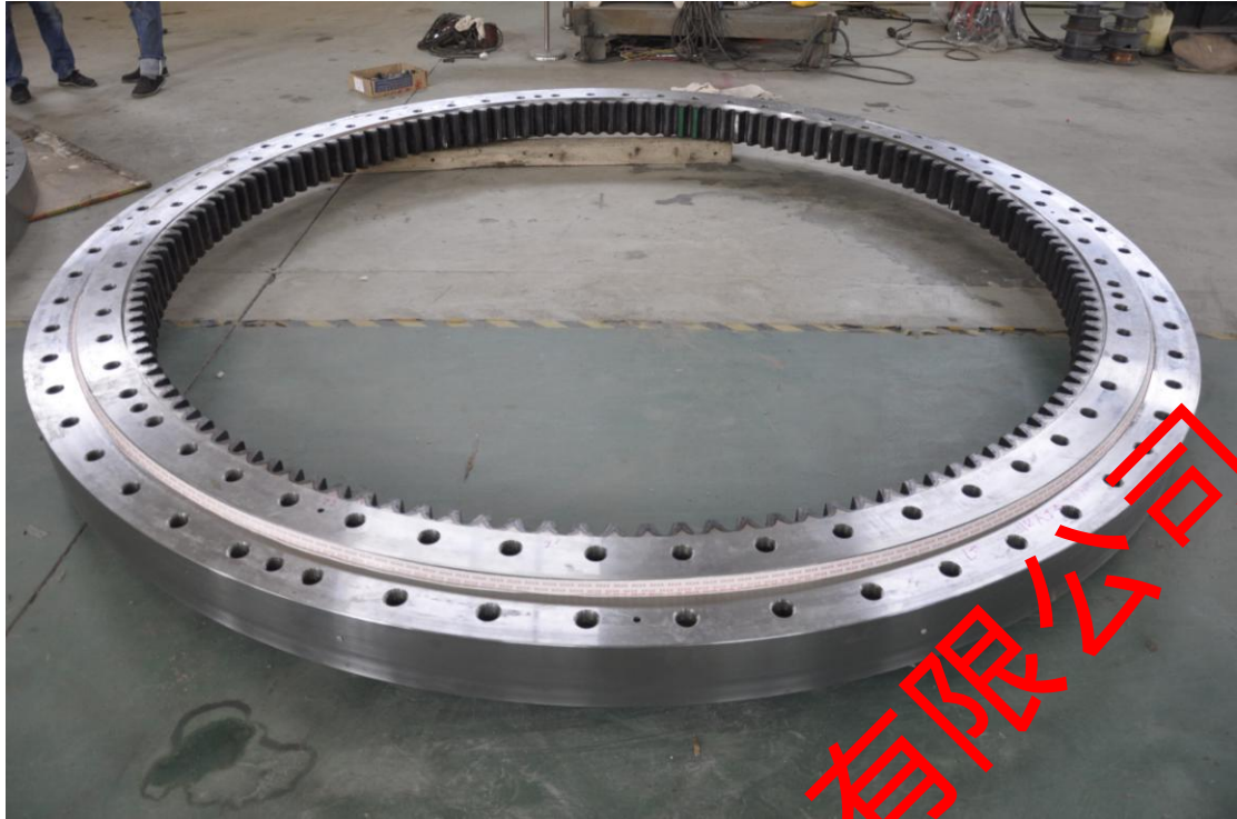
喷涂后涂层：轴承圈制备涂层